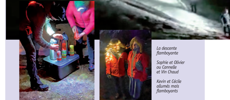
La descente flamboyante