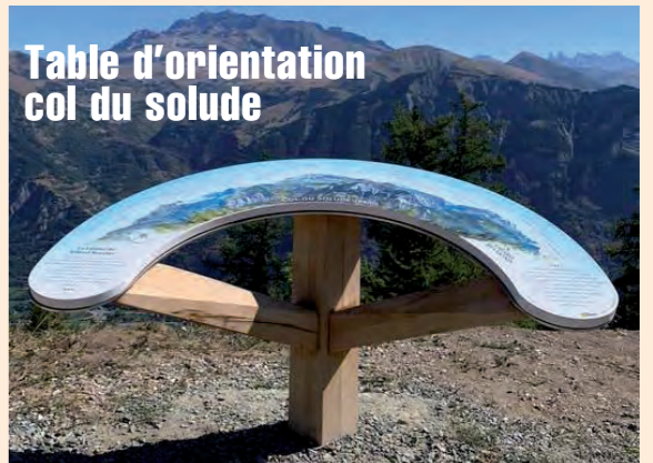
Table d'orientation col du solude

Elle fut reconstruite aux 18 et 19 ème siècles sur l'emplacement d'une dépendance, du 11 ème siècle, du Prieuré de Bourg d'Oisans. Souffrant des mêmes maux que la Cure, dus à l'enduit de ciment qui le recouvre, cet édifice historique ne peut être laissé en l'état. Le diagnostic met en lumière une fissure qui court de la façade sud jusque sur la dalle de la nef. Avant de pouvoir lancer cet important projet de rénovation nous devons faire installer des jauges sur cette fissure pour en contrôler l'évolution sur un an.